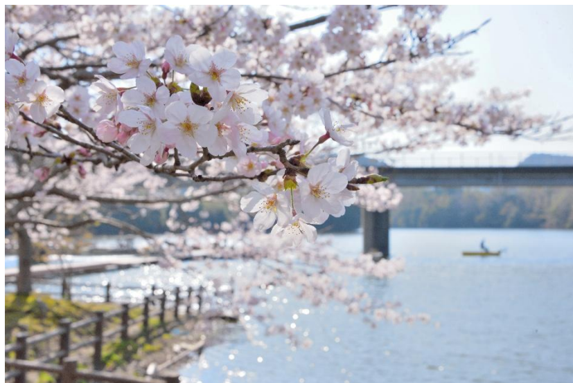
【月毛地区湖畔公園の桜】