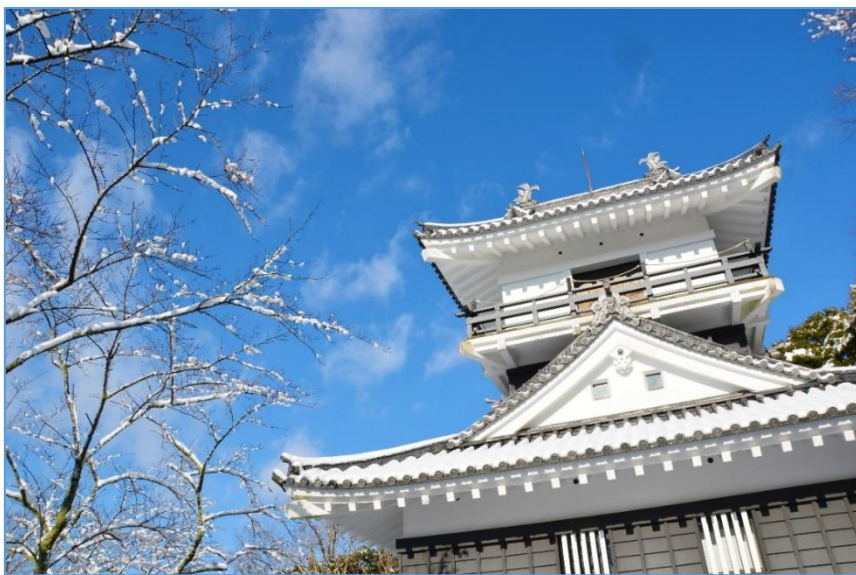
【冬の久留里城】