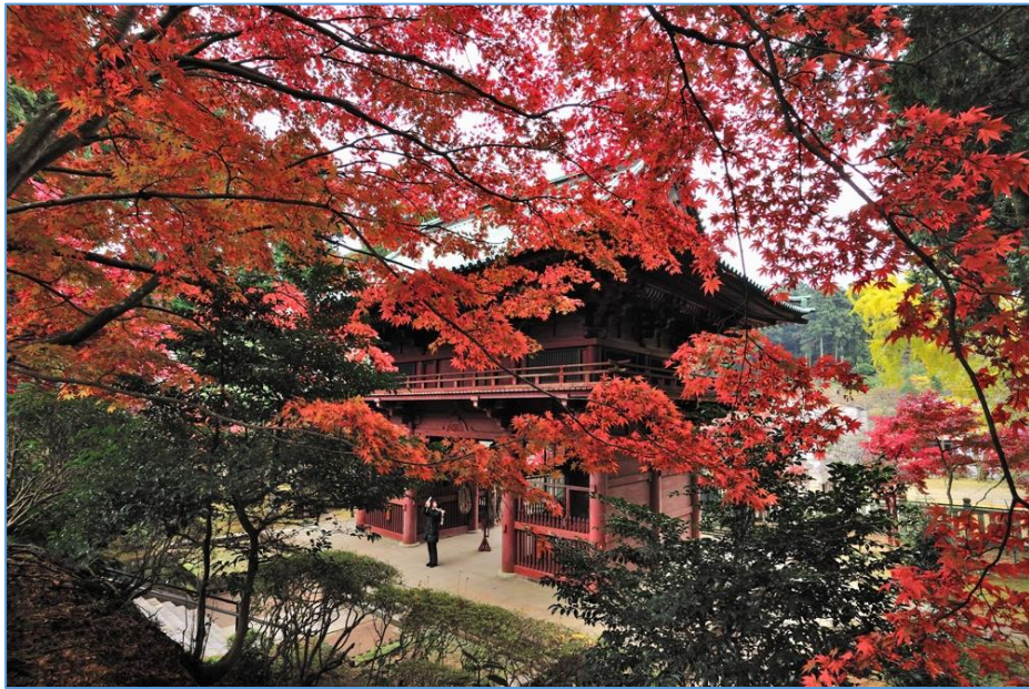
【紅葉に染まる鹿野山神野寺】